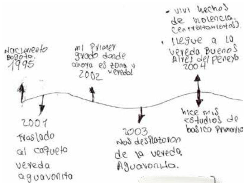
Gráfica Línea del Tiempo. Taller Encuentro con la comunidad. 27.03, 2021

También en esta ocasión los participantes realizaron las líneas de tiempo que dan cuenta de sus historias personales, de su relación con el territorio y los sucesos que en el acaecieron.