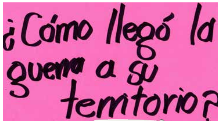
Gráficas y testimonios elaborados por los participantes. Taller Encuentro con la comunidad. 10, 04, 2021

La escuela aparece con claridad como posibilitadora de resistencia y como garantía de un futuro en paz.