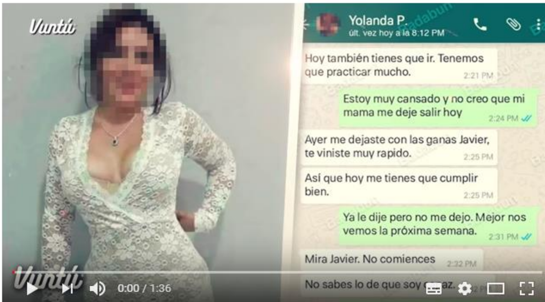
Maestra de secundaria abusaba a sus estudiantes