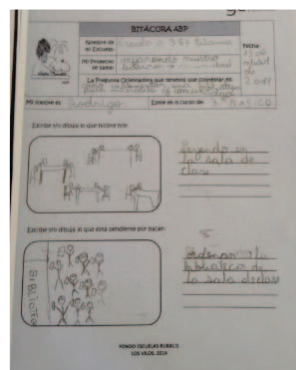
Bitácora para 1° Ciclo

En esta fase: (i) se planificaron seis visitas a cada una de las escuelas, donde se monitoreó la ejecución de los proyectos; (ii) se generaron espacios de reflexión por parte de los docentes en cuanto a cómo se iba dando el proceso de enseñanza-aprendizaje, a través de diversos instrumentos (por ejemplo, modelos propuestos por Barrel en 2007); (iii) se orientó para el diseño y aplicación de herramientas de evaluación (elaboración de bitácoras y rúbricas, entre otros); y, (iv) se facilitaron canales de comunicación a distancia (uso de red social WhatsApp y colaborativa Yammer), a través de las cuales se fomentó el intercambio de información entre las escuelas para compartir los avances logrados, así como también el que pudieran intercambiar documentos interesantes para potenciar la ejecución de uno o de todos los proyectos.