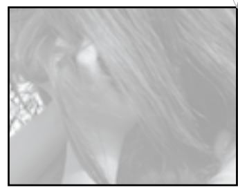
Actividad 2/ Pág.69