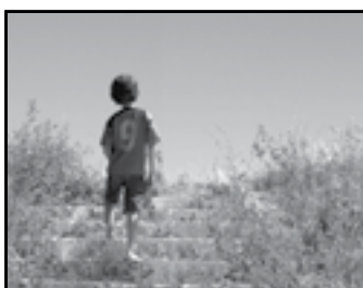
Actividad 1/ Pág.29