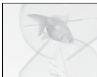
Actividad 2/ Pág.35