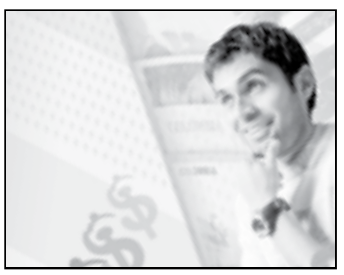
Actividad 1/ Pág.55