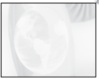
Actividad 2/ Pág.61