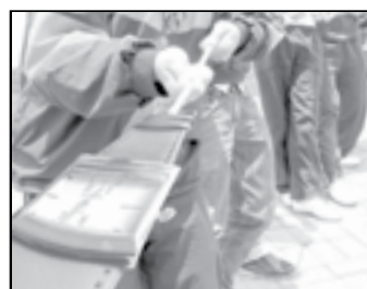
Actividad 2/ Pág.37