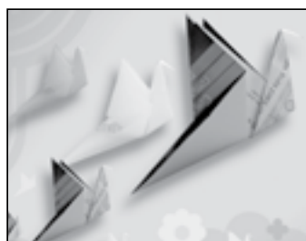
Actividad 1/ Pág.27