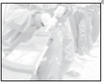
Actividad 2/ Pág.37