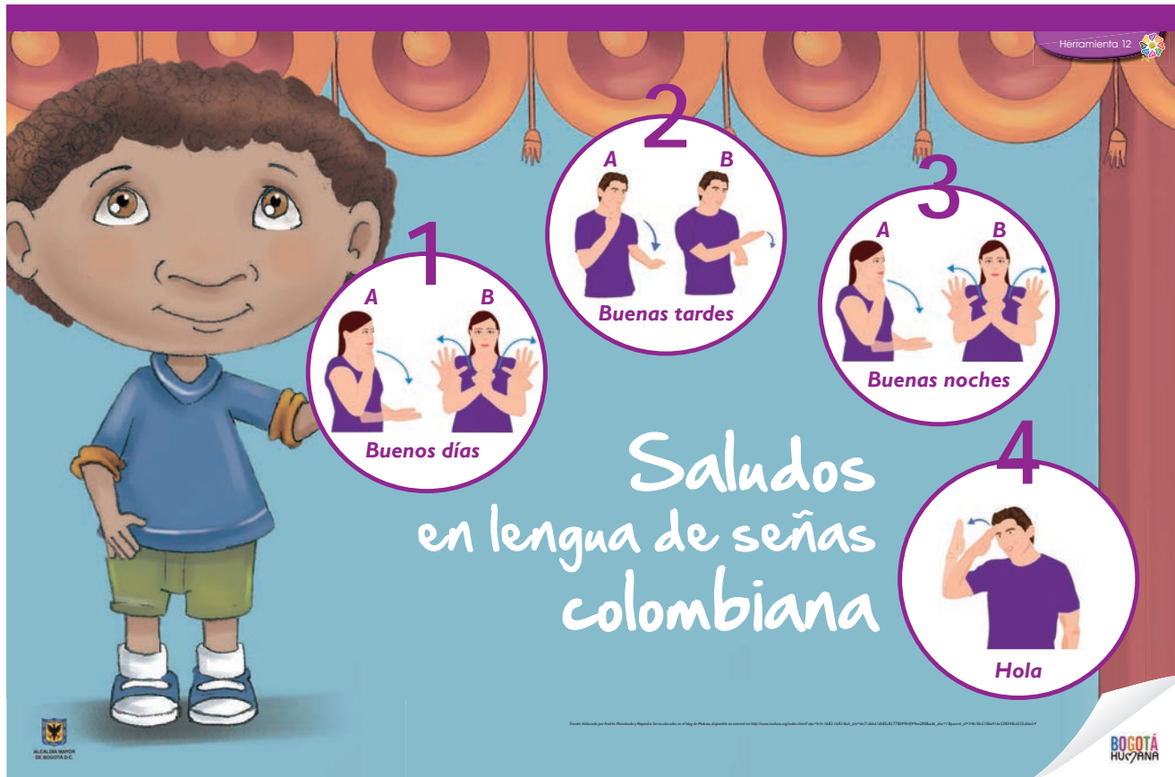
Figura 3. Saludos en lengua de señas colombiana.

Luego, le presentamos al grupo los afiches (véase figura 3) con los saludos y la familia en LSC (elaborado por Andrés Marulanda y Alejandra Serna, ubicados en el blog de Makaia, disponible en internet en http://www.makaia.org/index.shtml?apc=h1e-1682-1682-&sh_itm=da71debd1db85c85778049b4f49ae280&add_disc=1&parent_id=34b10e5106a916c538348cd355cbba54 ).