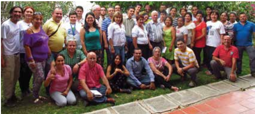
Foto 3. Encuentro Binacional realizado en Ureña, Venezuela, en 2014

¿Cuál es la diferencia entre nacionalidad y ciudadanía?, ¿desde cuándo se es ciudadano?, ¿el sujeto político es el mismo ciudadano?, ¿qué diferencia hay entre ser ciudadano y ejercer la ciudadanía?, ¿cómo se vincula la ciudadanía y la identidad?, ¿cómo estaría definida la ciudadanía desde lo social y cultural?, ¿qué ciudadanía ejercen los jóvenes?, ¿qué formación ciudadana deben recibir? y ¿cómo se configura la ciudadanía en un espacio de tensión entre los ordenamientos jurídicos de las naciones fronterizas?