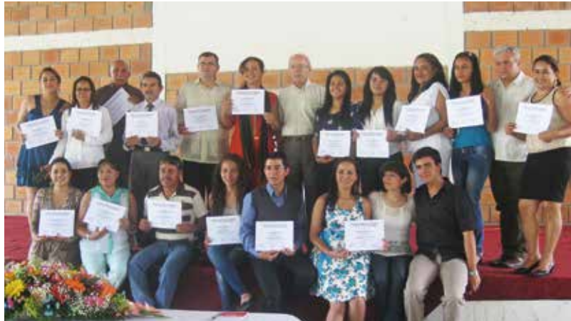
Foto 8. Graduación del Diplomado en Formación Política y Ciudadana. Escuela Arauca-Guasdalito. 2014