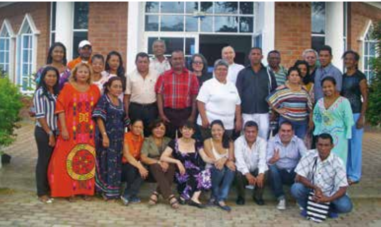
Foto 5. Encuentro Binacional, realizado en Riohacha, 2014.