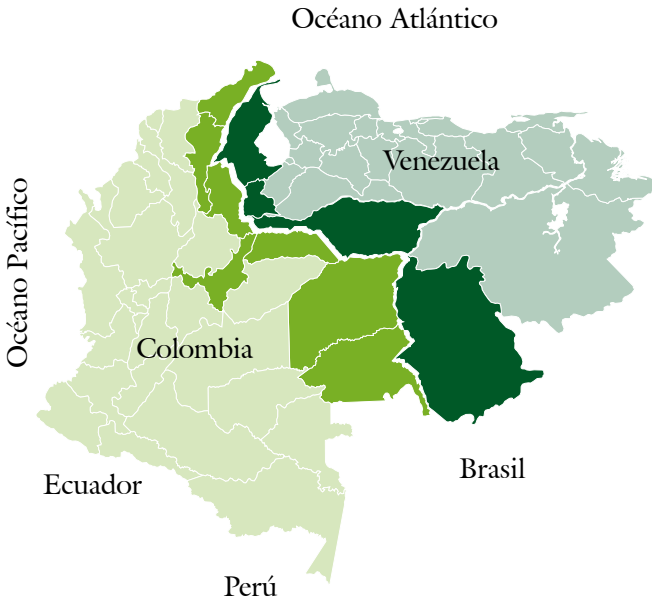
Figura 1. Mapa de la frontera colombo-venezolana

Nota: mapa realizado por Mauricio Salamanca.