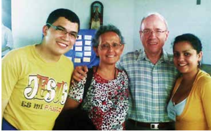
Foto 1. Encuentro Binacional realizado en Ureña, Venezuela, en 2012.

obtienen poderosas organizaciones ilícitas de contrabando de gasolina, alimentos y narcotráfico.