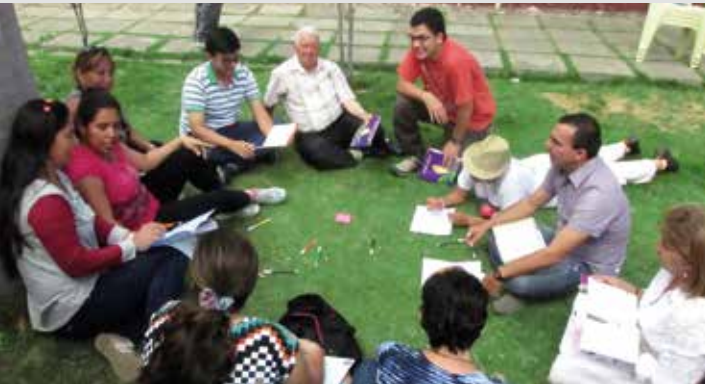
Foto 7. Análisis interdisciplinario del contexto de la frontera colombo-venezolana. Ureña, Venezuela. 2014.