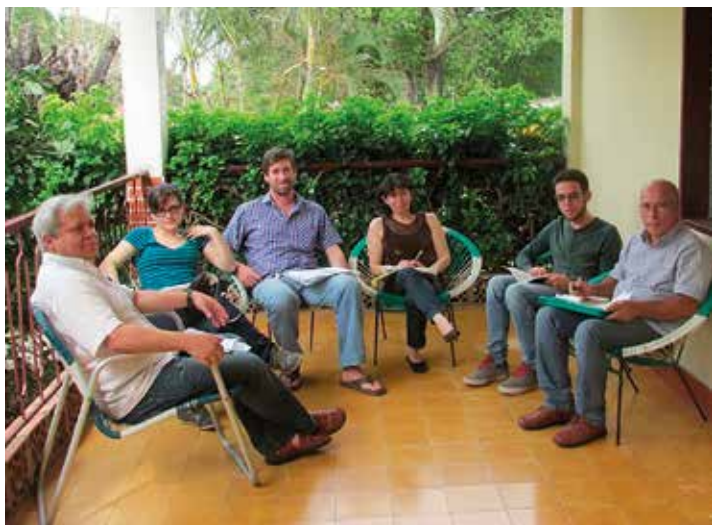
Foto 2. Equipo de trabajo de la EPCC, 2014.