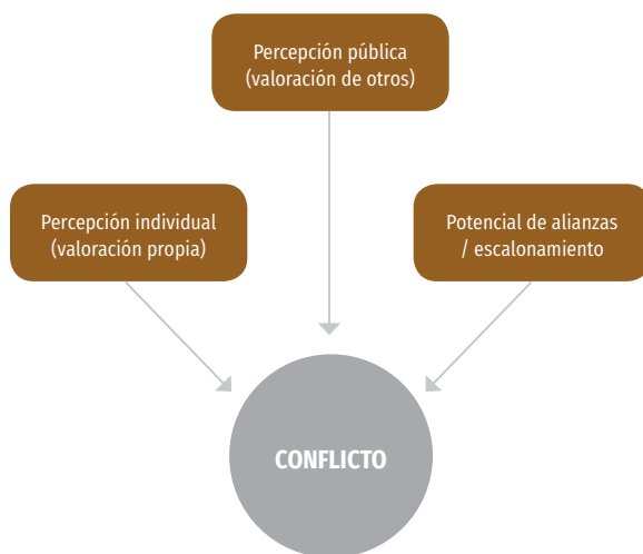
Gráfica 1. Tres elementos constitutivos de los conflictos.

+ Condición 1. Percepción (valoración propia). El primer elemento de esta definición implica que debe existir una percepción por parte de los involucrados de que, en efecto, existe una incompatibilidad de sus intereses en relación con un asunto concreto. En otras palabras, los actores involucrados directamente interpretan, a partir de ciertos 'marcos cognitivos' (entendidos como formas de ver el mundo), los elementos de la disputa. Al parecer obvia, esta primera acotación excluye todas aquellas situaciones de conflicto que experimentamos cotidianamente pero que, dentro del esquema de prioridades que orientan nuestra acción, consideramos irrelevantes: no nos esforzamos por comprenderlas ni las valoramos como un acontecimiento que nos afecta.